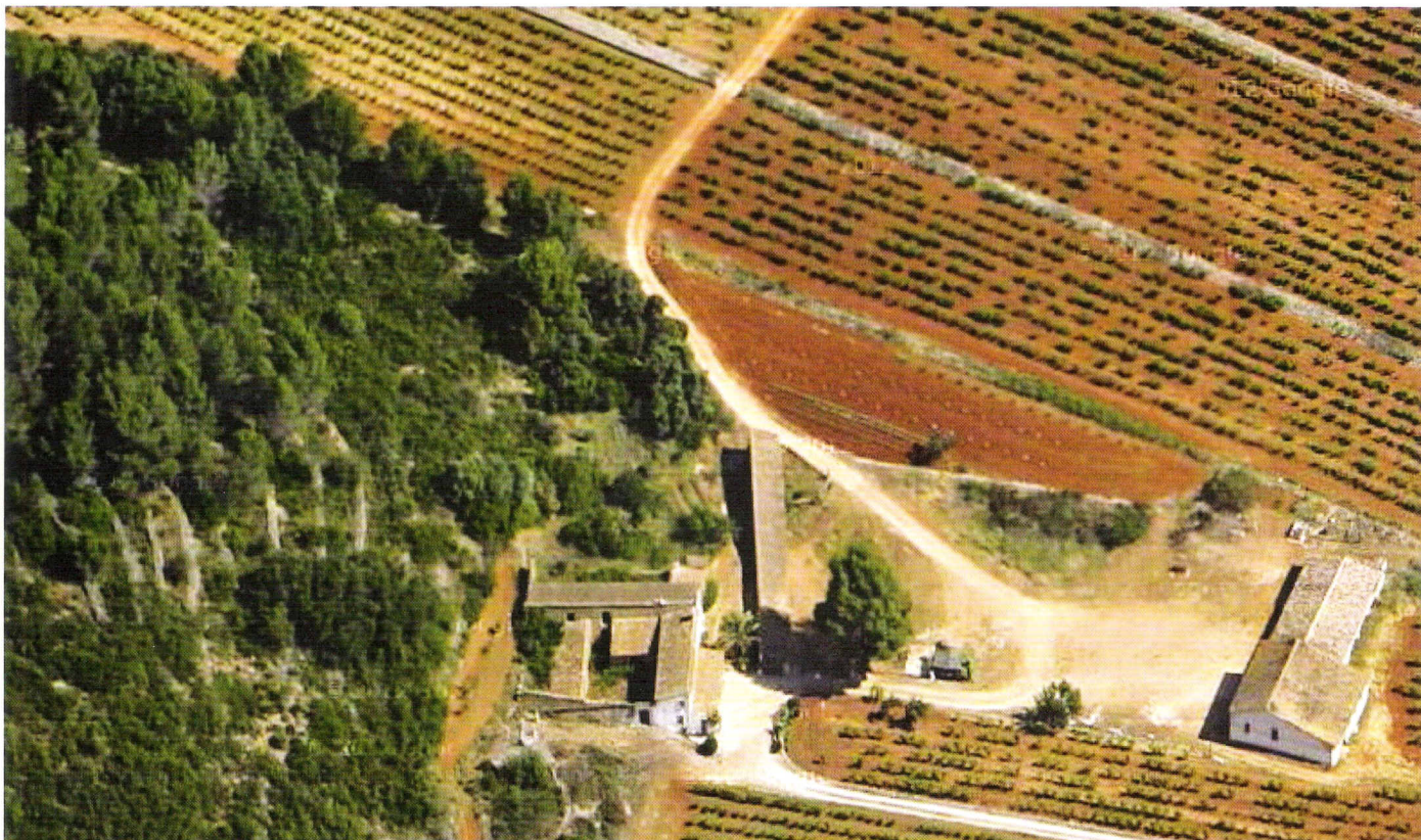
Fig. 1: Vinya d'Avargues, en la partida de La Cuta de Llíber

La rèplica de l'al·ludit va arribar al cap de vint i pocs dies, i en ella arremetia durament contra aquesta acusació. 4 Grimalt començava dient que