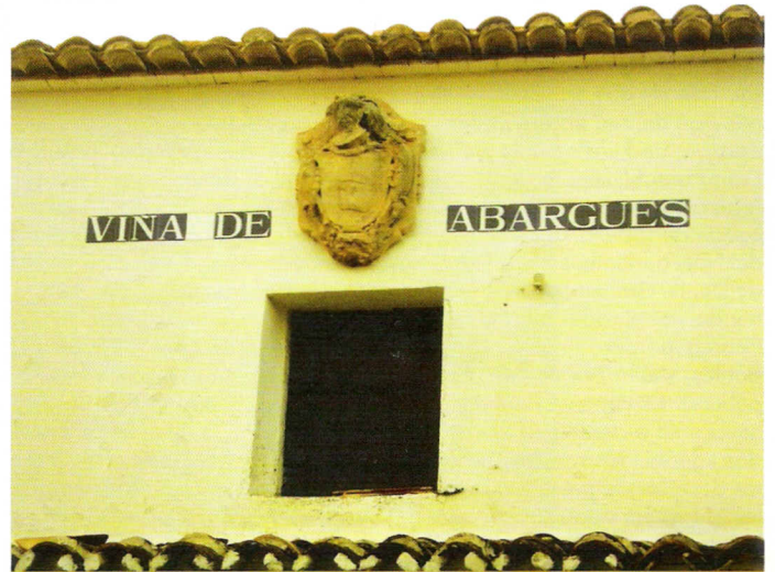
Fig. 2: Façana de la casa de la Vinya d'Avargues, amb l'escut nobiliari de la família

Por estos mismos hechos, ¿no fué detenido y preso en la cárcel pública, por la Guardia Civil, el casero de la mencionada Viña de Avargues, hermano de un concejal elegido en las últimas y otras varias elecciones, solo