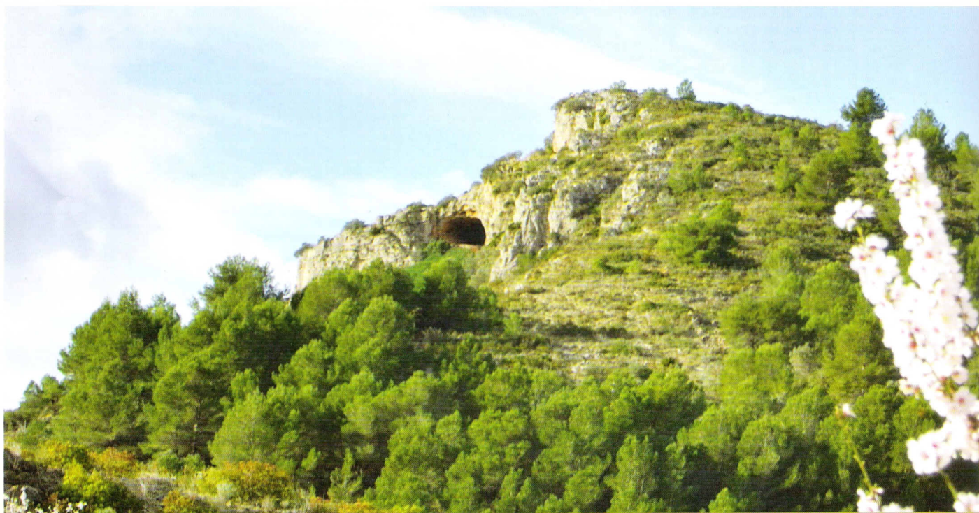
Fig. 3: Cova de la Garganta

Tornem al caliu d'això, ja per a acabar, a la Vinya d'Avargues, perquè es tracta d'un exemple que il·lustraria a la perfecció la protecció que els cacics van poder brindar als roders. Aquesta propietat, situada en la partida de la Cuta del poble de Líber, i que segurament vinga a coincidir amb una propietat de 25 jornals que un avantpassat de Joaquim Avargues declarava tenir el 1792 a Xaló en la mateixa partida, 8 hauria estat segons les denúncies que feia Grimalt una mena de "refugi ocasional" dels bandolers, si no una autèntica "base d'operacions". Resulta curiós observar, des d'aquest punt de vista, que una bona part de la quadrilla de la Tona va ser de procedència xalonera i dels pobles veïns, com demostren diverses notícies que van aparèixer un temps després que la Guàrdia Civil haguera capturat i matat La Tona el cinc de maig del 1875. 9 Així, als cinc mesos de la seua mort, a Xaló era capturat "un tal Mascaró, á quien se le acusa de haver formado parte de la gran cuadrilla de secuestradores que en aquella comarca dominava" . 10 De la mateixa