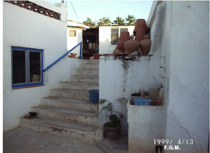
Imatge parcial de la terrisseria l'any 1999

l'Empalme, els diumenges començà l'excavació del futur forn. Li van ajudar amics i alguns veïns. Eren habituals aquestes ajudes dels amics i els veïns. Eren favors "a torna", com es deia. Era costum prou estesa que el favor, si podia ser, acabara en un sopar. El sopar sempre es feia quan en la casa hi havien conills o pollastres matadors. I res més, ni un céntim malgastat. Es feien coses, es vivia, en la més mínima necessitat econòmica. Estaven acostumats a viure sota mínims i els diners semblaven fantasmes, no els veien mai. Aquesta escassetesa econòmica la solucionaven "baratant" tot el que podien. Després de sopar es feia un perol de malta, es treia la botella d'anís o mistela per a les dones, i la de cassalla o aiguardent per als hòmens i esdevenia una nit en què per unes hores s'oblidaven els problemes, les carències de tot tipus i l'ambient repressiu al que estaven sotmesos. En aquests sopars sempre hi havia algú que sabia tocar la guitarra i amb el calor de l'estómac satisfet, sempre hi havia algú que s'arrancava cantant alguna cançó de moda o alguna alçada. A una hora prudencial cadascú se n'anava a sa casa a dormir. I si hi havia alguna cosa més que dormir, millor. Com de moment no costava diners, ens ho podíem permetre. Encara que fóra dissabte a l'endemà s'havia de treballar, en la casa pròpia o en la d'algun veí. Eren nits en les quals es consolidaven les amistats, en la que els valors humans purs, tardaven a oblidar-se. En algunes ocasions no s'han oblidat mai.