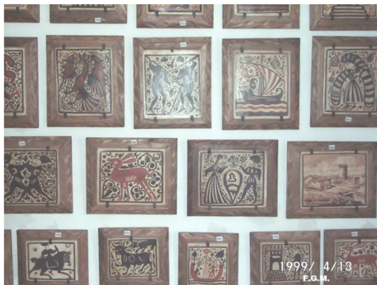
Socarrats en la exposició

Va incorporar a la seua producció "els socarrats", eixa magnífica peça tan representativa en la ceràmica de Paterna. De la terrisseria de Paco Giner han eixit centenars de "socarrats", reproduint les famoses peces medievals que decoraven els sostres de les cases benestants de l'Antic Regne, i molts sostres dels palaus de mitja Europa on tenia presència la Corona Catalanoaragonesa.