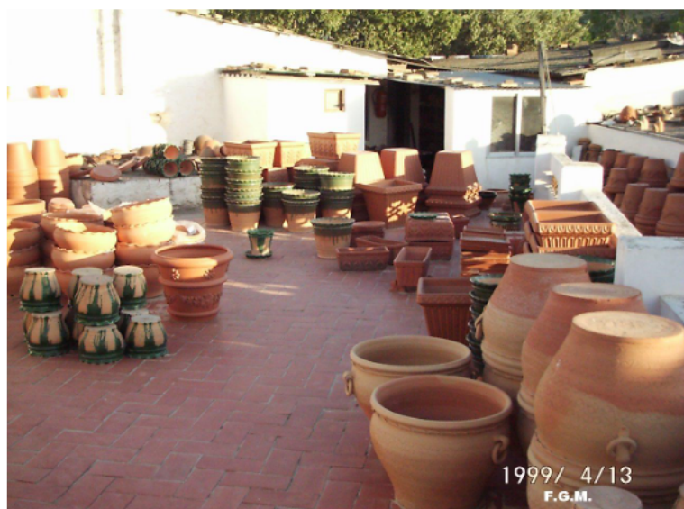
Vista terrassa de la terrisseria

Jo he vist a Paco Giner moltes vegades treballar el torn. Em quedava meravellat veient com a partir d'una peça de fang, utilitzant un braç per dins i un altre per fora, anava alçant una