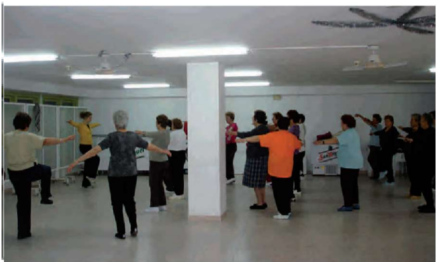
Activitats Centre Social Bèrnia