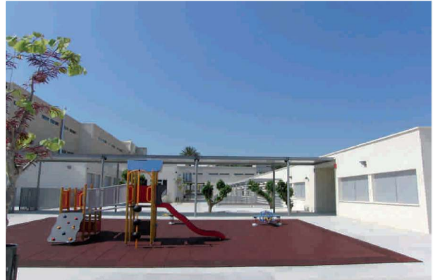
Nou Col·legi Manuel Bru

En estos últimos años de gobierno municipal del Partido Popular se han hecho muchas cosas en Benissa, gracias a ti y a la confianza que nos has dado. No hace falta que te las contemos todas, porque las conoces y se pueden ver.