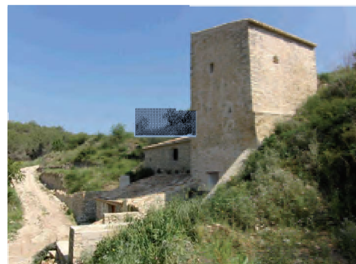
Molí del Quisi