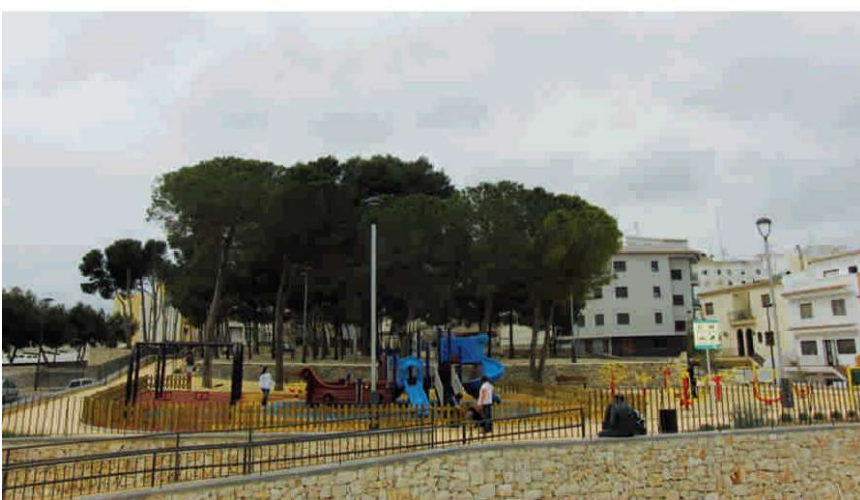
Parc Infantil Pinada de Selva