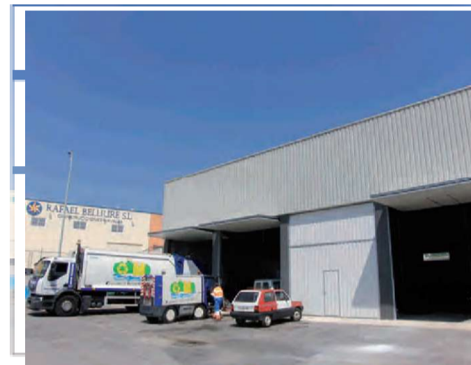
Noves Instal.lacions Benissa Impuls

Solidaritat, responsabilitat, transparència, austeritat i diàleg són els nostres principis.