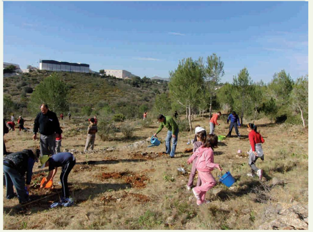
Dia de l'Arbre