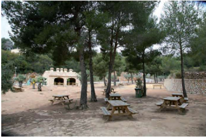
Zona d'oci Magraner