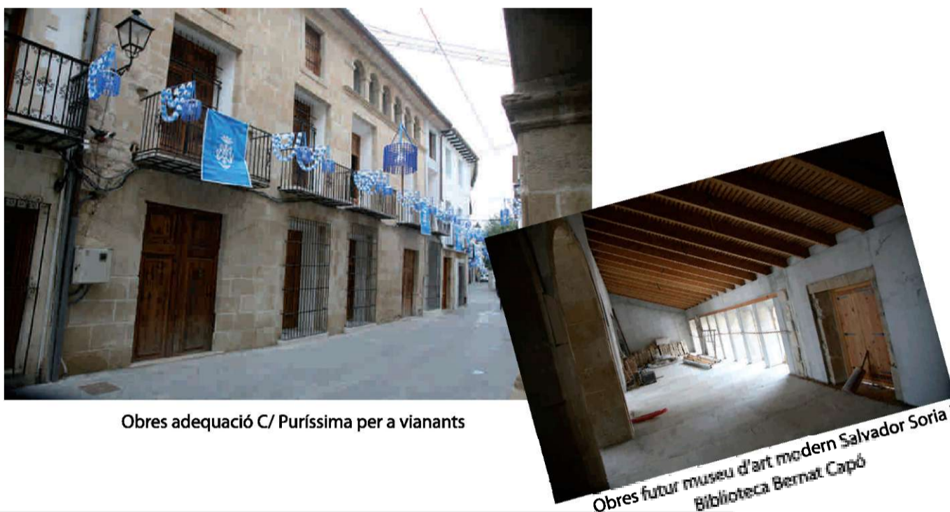
Obres adequació C/ Puríssima per a vianants