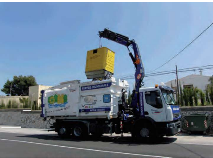
Nou vehicle per a la recollida selectiva de residus