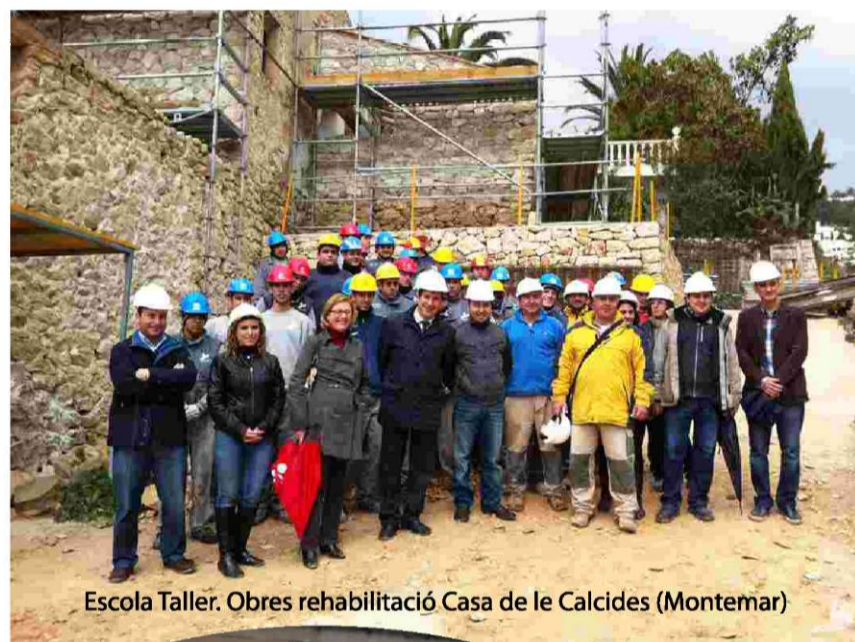
Escola Taller. Obres rehabilitació Casa de le Calcides (Montemar)