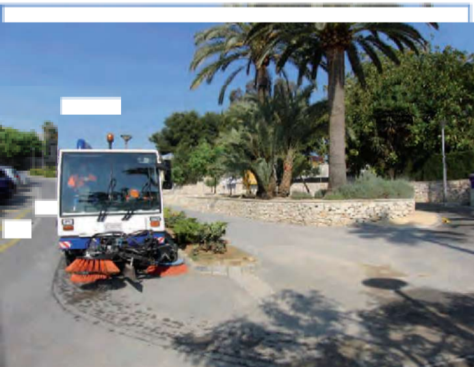
Adquisició d'agranadora zona costera

Solidaridad, responsabilidad, transparencia, austeridad y diálogo son nuestros principios.