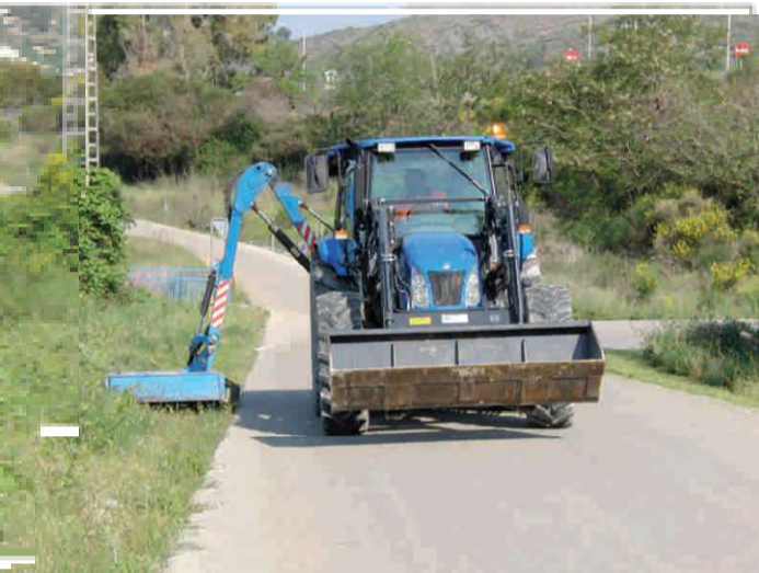
Adquisició màquina desbrossadora