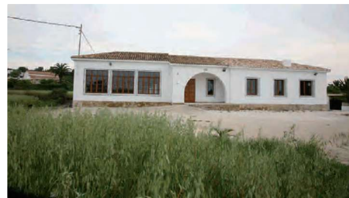
Rehabilitació Escoles Pedramala