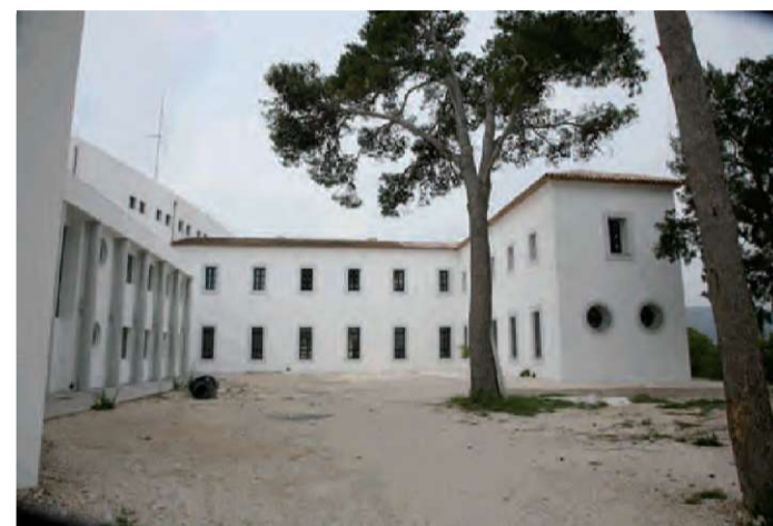
Seu musical per a Cor i Banda