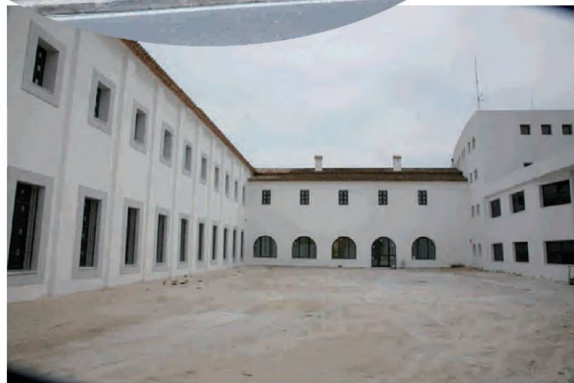
Centre Noves Tecnologies. Seminari Franciscà