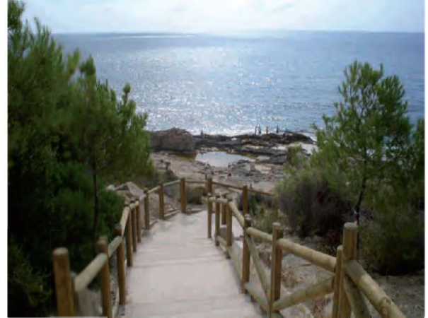
Passeig Ecològic Litoral