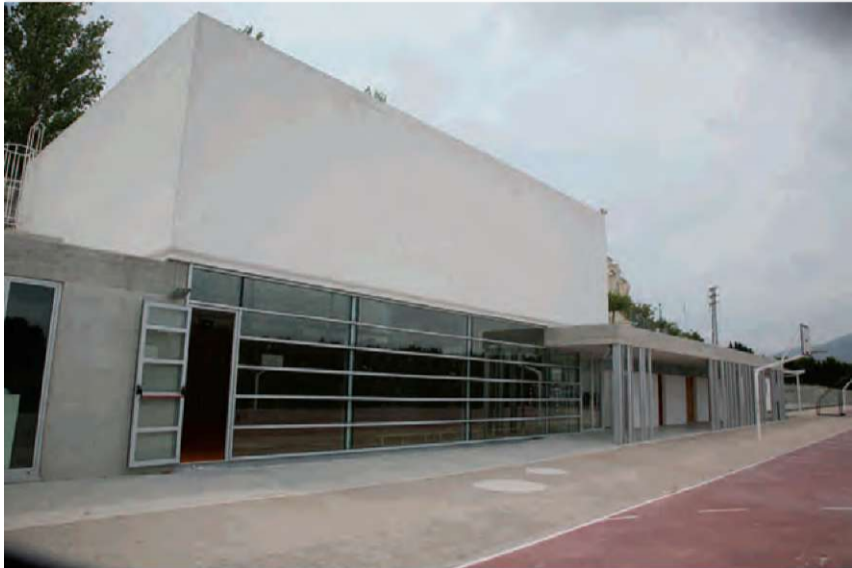
Gimnàs C.P. Padre Melchor