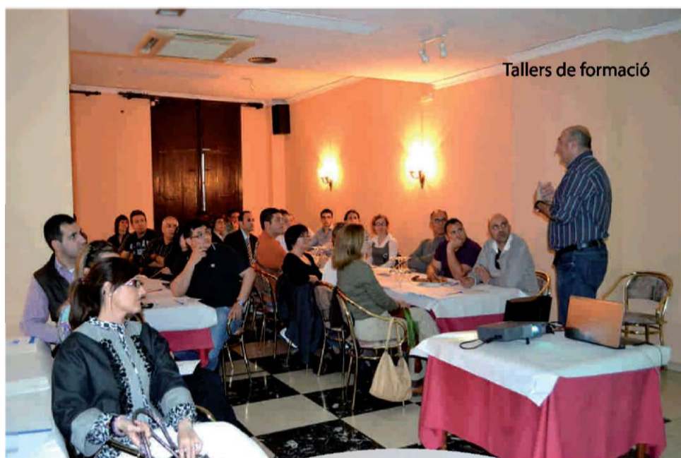
Tallers de formació