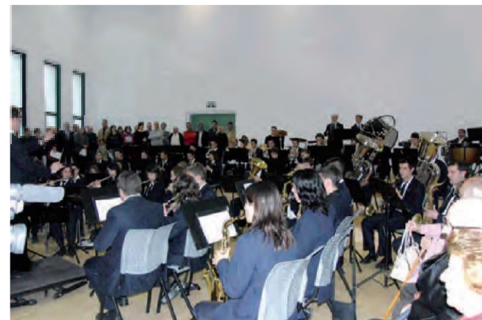
Seu musical per a Cor i Banda