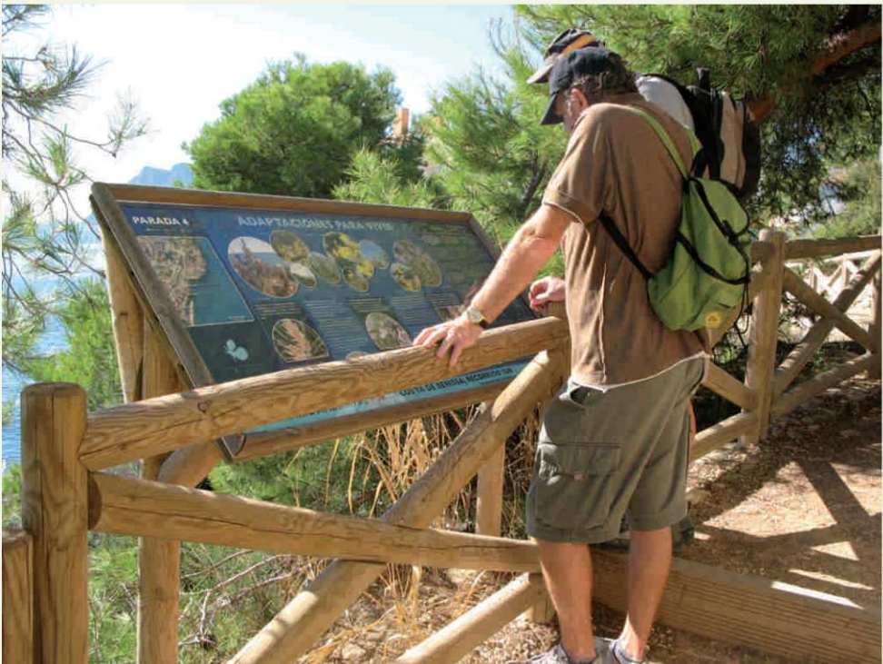
Recuperació ambiental Passeig Ecològic