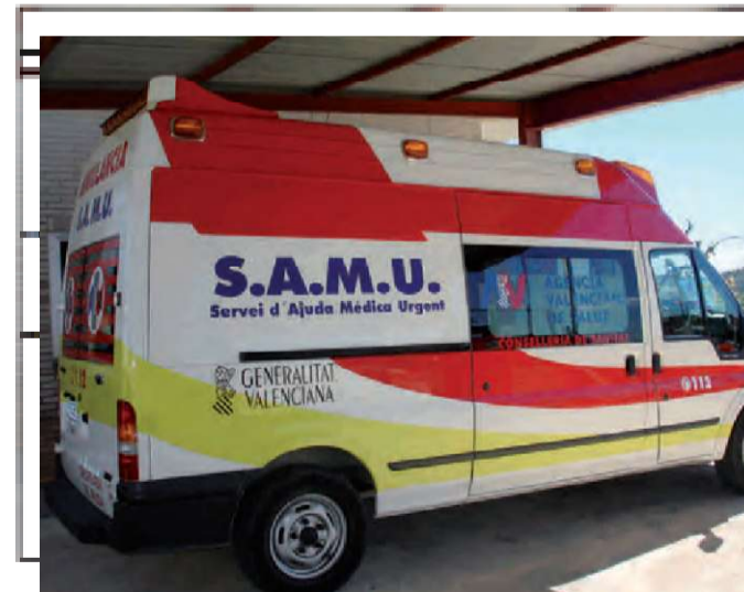
Nova unitat SAMU

El Partido Popular de Benissa ha reducido en un 50% los gastos de esta campaña electoral y destinará 3.000 Euros a Cáritas Parroquial Benissa