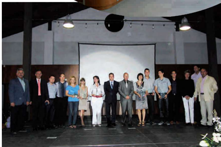
Premis Benissa és Qualitat