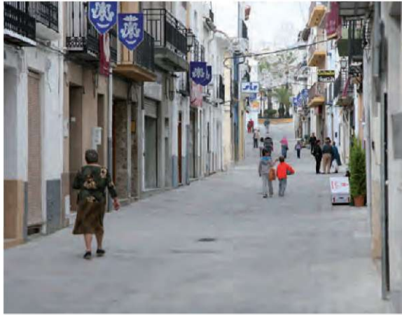
Obres adequació C/ Sant Nicolau per a vianants