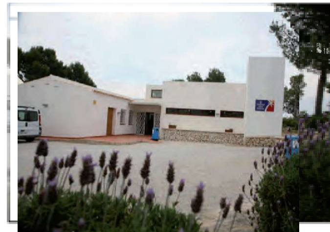
Futura OAC zona costera