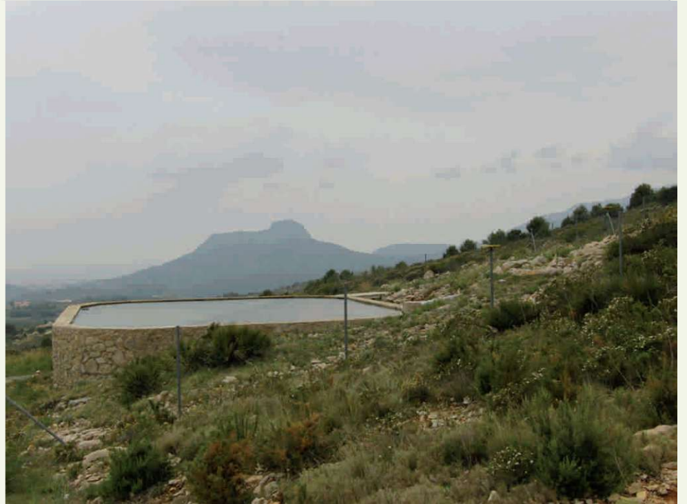
Projecte de reforestació i prevenció d'incendis en la Solana

Conservar nuestro entorno es la mejor herencia que podemos dejar a nuestros hijos.