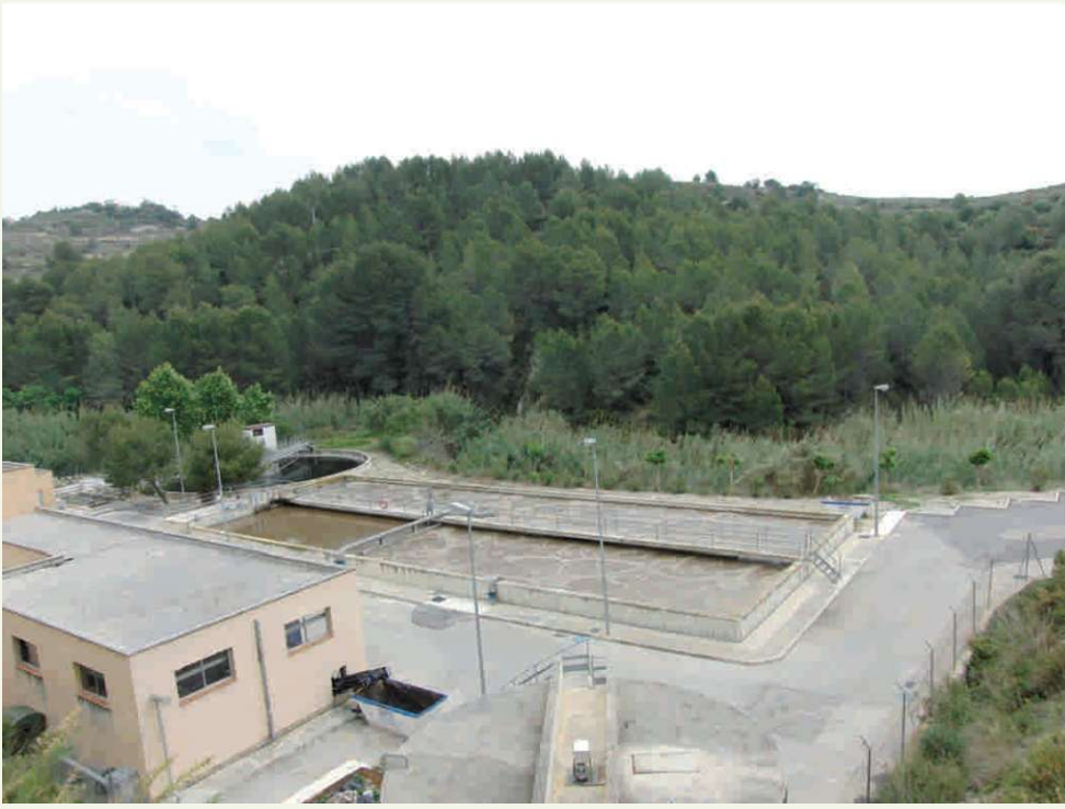
Reutilització de les aigües de la Depuradora