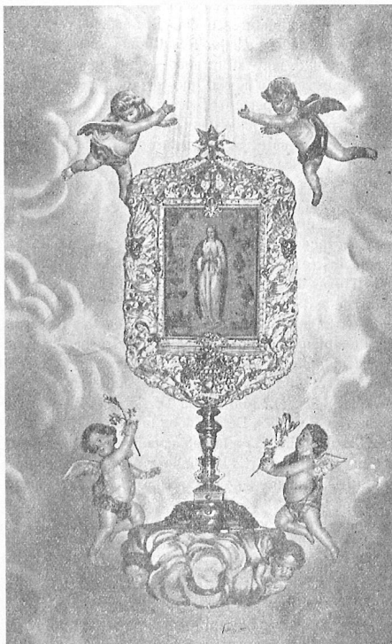
Fig. 1: Nou reliquiari de la Puríssima uns anys abans del bicentenari

Per la data que figura en el document, els dies 27 i 28 d'abril del 1884, aquesta desfilada ha de relacionar-se, inevitablement, amb una celebració que va tenir lloc a Benissa aquell any i que per la seua importància degué centrar en bona mesura l'atenció del poble: la commemoració, durant les festes patronals, del bicentenari del patronatge de la Puríssima Xiqueta (fig. 1). Els dies 27 i 28 d'abril, en aquest sentit, queien justament en l'últim diumenge i dilluns d'abril (data en què se celebraven des d'antuvi les festes patronals a Benissa), i estarien indicant-nos en conseqüència els dies per als quals s'havia de servir la comanda. Potser, d'altra banda, que el lloguer de dos dies estava indicant que anaven a fer-se dues representacions o desfilades, una cada dia.