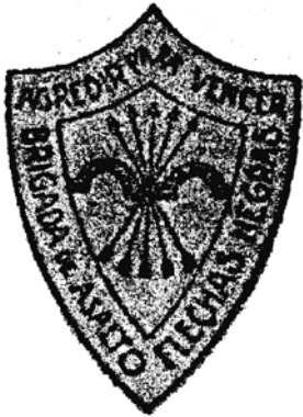
Detall de capçalera d’un document de les “Flechas Negras”.

com a “roja”, allotjada en una caseta de Canor. Malgrat ser el primer document relacionat amb les primeres detencions de republicans i d’antifeixistes, tot indica que la repressió ja havia començat des del mateix 1 d’abril, sota el comandament de la Falange, la qual també s’encarregà d’organitzar el seu empresonament i vigilància a Benissa.