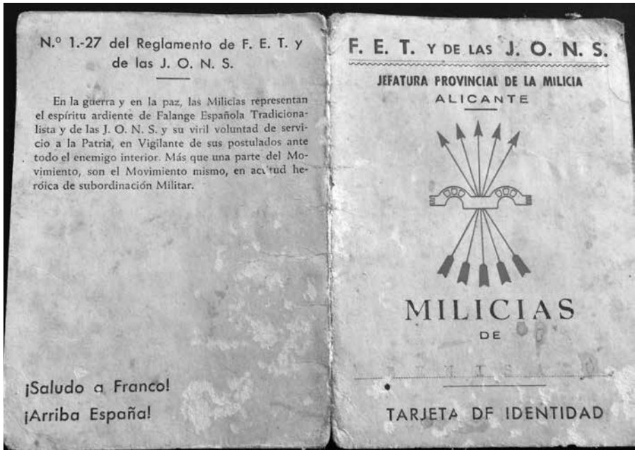
Carnet de Falange. Benissa, 1940.