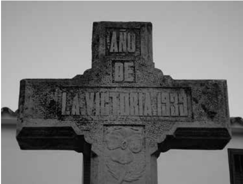
Detall de la creu de Pinos, Benissa. 1939. Fons Fer la Guerra.

Les investigacions de Francisco Moreno i de Robert Llopis, ara per ara, documenten un total de 190 benissers i 4 benisseres represaliades per la dictadura franquista (més 15 homes d'altres pobles que eren veïns de Benissa). 11 119 benissers i 1 benissera van ser objecte de consells de guerra franquistes. 107 dels represaliats havien sigut combatents de l'Exèrcit Popular de la República, i entre aquests, 43 havien sigut voluntaris. Tot just, 26 militars voluntaris de Benissa van ser penats després de la Guerra Civil a batallons de treball i batallons disciplinaris de l'Exèrcit Franquista.