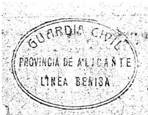
Segell de la Guàrdia Civil de Benissa. 1939.

la voluntat d’afermar el sentiment catòlic i la pròpia victòria franquista, encara que les circumstàncies de fam i pobresa no propiciaven un ambient festiu, i més si tenim en compte la repressió política que estava començant a produir-se aleshores. Els militars van desfil·lar en la processó de la Puríssima Xiqueta, i els oficials impulsaren un bategament massiu d’uns 30 xiquets, als quals apadrinaren ells individualment, d’un conjunt de més de 300 infants nascuts durant la guerra.